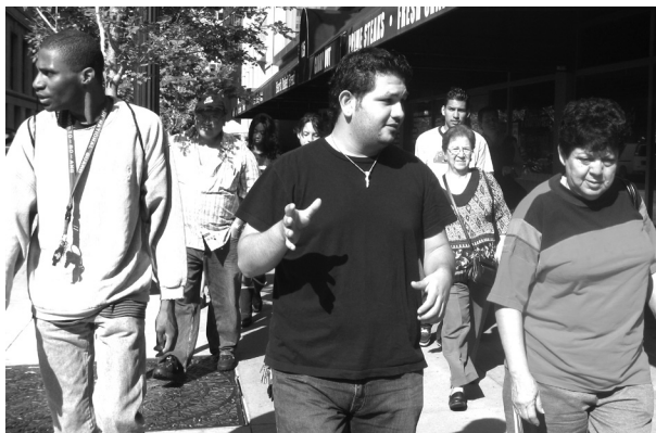
Activistas de LVEJO van a una reunion sobre la limpieza de Celotex.

del sitio eran los que presentaban algunas de la concentraciones de PAH más altas, llegando a sobrepasar las 100 ppm en algunos casos. (Vea el recuadro abajo)