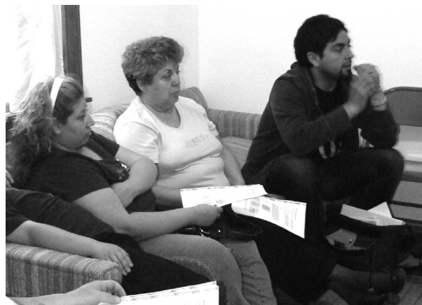
Vecinos se reúnen en la sala de un miembro de LVEJO.

La ley del estado de Illinois establece que las concentraciones de PAH en el suelo no deben sobrepasar 0.001 ppm. Descubrimos que muchos hogares de nuestro vecindario estaban contaminados. Resultaba interesante el hecho de que los hogares más alejados